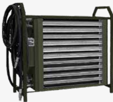
Euroheater MIDI vifte